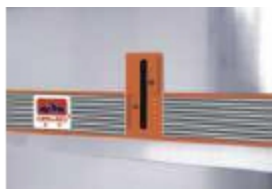
Окно уровня воды