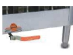
Кран для слива для предотвращения образования отложений