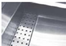
Съемная крышка для слива