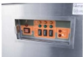
Переключатели с защитой от попадания влаги