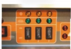
Селектор уровня мощности (3 уровня)