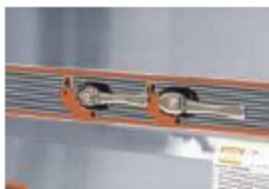
3 уровня мощности