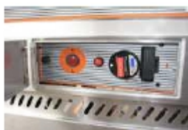
Система розжига защищена заслонкой