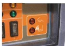
Автоматическая система слива для предотвращения образования отложений